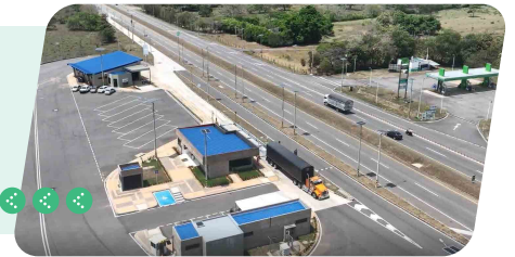
Control inteligente del transporte - Báscula de Yopal (Km 93)

Sistema automatizado combina pesaje dinámico y estático, permitiendo controlar vehículos de carga en movimiento en menos de 30 segundos.