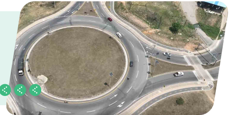
Puerta directa a la ciudad de Yopal - Glorieta Calle 30 (Km 102)

Permite ingreso directo al casco urbano de Yopal o continuar hacia el intercambiador El Morichal, mejorando accesibilidad y circulación en la ciudad.