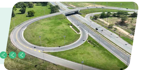
Conexiones seguras en todos los sentidos - Intersección El Coleo (Km 80+700)

Aquí se conectan de forma segura los movimientos Aguazul - Yopal, Aguazul - Villavicencio y Yopal - Aguazul gracias a sus accesos a nivel y paso elevado.