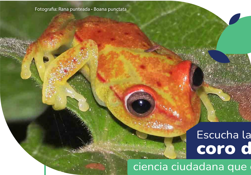
Fotografía: Rana punteada - Boana punctata