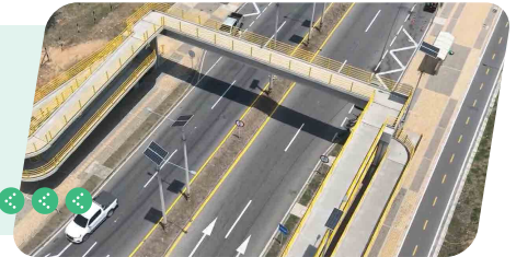
Seguridad para el peatón - Puentes peatonales

Ocho puentes peatonales con rampas, pasarelas amplias y orientación podo táctil garantizan accesibilidad, seguridad y tránsito inclusivo para todos los usuarios.