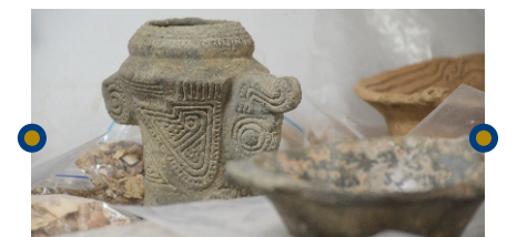
Pieza arqueológica restaurada

Es así como Covioriente continúa avanzando en la construcción del Corredor Villavicencio - Yopal, aportando, a su paso, a la reconstrucción de la historia y el legado arqueológico de la Orinoquía, una historia que, en el futuro cercano, estará al alcance de todos.