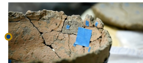
Proceso de restauración arqueológica