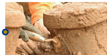
Vestigios arqueológicos rescatados

laboratorios donde actualmente se avanza con el proceso de análisis de información y restauración con elementos especializados que permitirán reconstruir el pasado arqueológico de los Llanos Orientales.