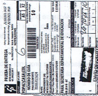
IMAGEN PRUEBA DE ENTREGA DE LA DEVOLUCIÓN