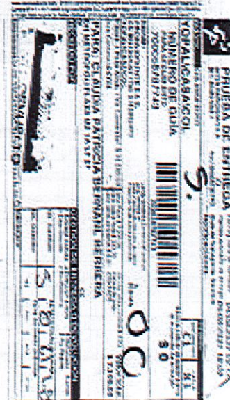
IMAGEN PRUEBA DE ENTREGA DE LA DEVOLUCIÓN