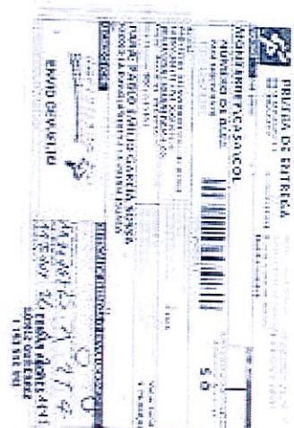
IMAGEN PRUEBA DE ENTREGA DE LA DEVOLUCIÓN