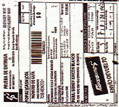
IMAGEN PRUEBA DE ENTREGA DE LA DEVOLUCIÓN