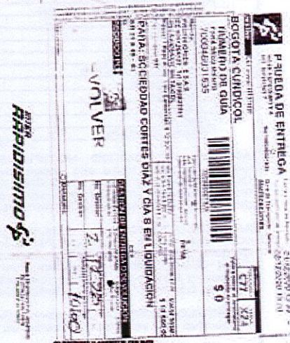
IMAGEN PRUEBA DE ENTREGA DE LA DEVOLUCIÓN