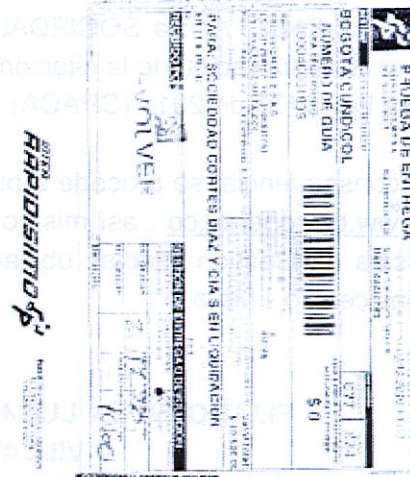
IMAGEN PRUEBA DE ENTREGA DE LA DEVOLUCION