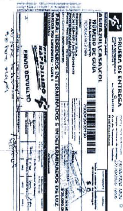
IMAGEN PRUEBA DE ENTREGA DE LA DEVOLUCIÓN