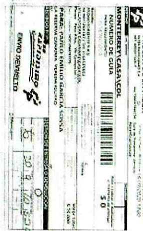
IMAGEN PRUEBA DE ENTREGA DE LA DEVOLUCION