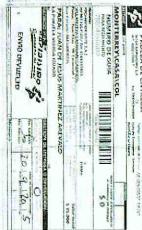
IMAGEN PRUEBA DE ENTREGA DE LA DEVOLUCIÓN