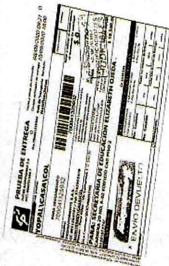
IMAGEN PRUEBA DE ENTREGA DE LA DEVOLUCIÓN