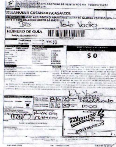
IMAGEN PRUEBA DE ENTREGA DE LA DEVOLUCIÓN