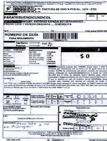
IMAGEN PRUEBA DE ENTREGA DE LA DEVOLUCIÓN