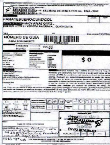
IMAGEN PRUEBA DE ENTREGA DE LA DEVOLUCIÓN