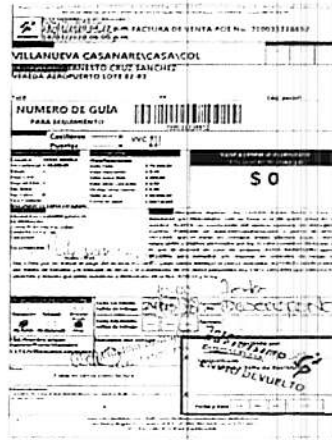
IMAGEN PRUEBA DE ENTREGA DE LA DEVOLUCIÓN