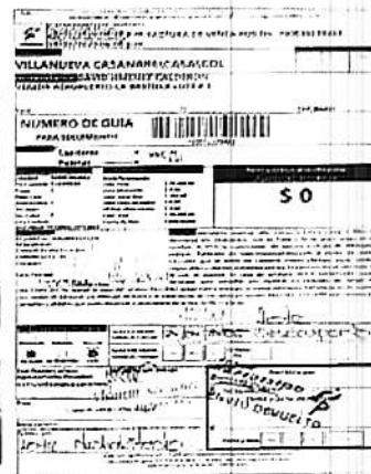
IMAGEN PRUEBA DE ENTREGA DE LA DEVOLUCIÓN